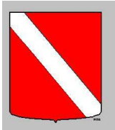
Wapen van Linschoten