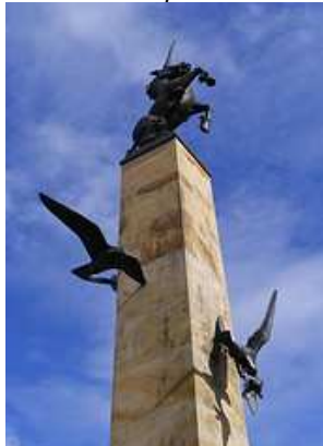
Een standbeeld van de Eenhoorn in Inverness (Schotland)

op: woensdag 28 september 2011 van 20.00-22.00 uur In: De Dam, Wilhelminaweg 79, 3441 XB Woerden