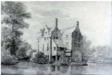
Huis Harmelen, in 1672 door de Fransen verwoest Tekening van Roeland Roghman (1647)

Een lezing door Rob Alkemade, archivist van het RHC Rijnstreek en Lopikerwaard