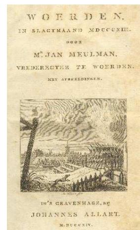
Titelpagina van het boek Woerden in Slag maand 1813

Wij zijn zeer ingenomen met dit boek, dat de heer Balm aan ons wilde afstaan. Over 2 jaar is het 200 jaar geleden dat de Ramp van Woerden plaats vond. Wij zullen daar in 2013 uitgebreid aandacht aan besteden. Daarbij zal dit boek, waarin de moordpartij door de Fransen gedetailleerd wordt beschreven, ongetwijfeld een rol spelen