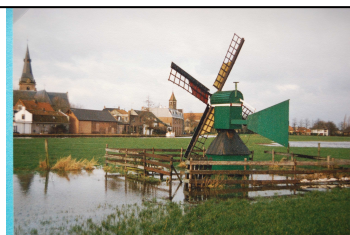
De Kroosduiker voorheen in Harmelen, thans Zaanstad.