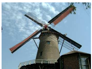
De Windotter in IJsselstein