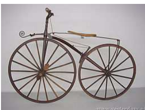
Michaux "boneshaker" van ca. 1870

op: maandag 28 mei 2012 van 11.00-15.00 uur Vertrek: vanaf het Kasteel, Kasteel 3, 3441 BZ Woerden