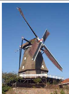
De Valk in Montfoort

Op deze molendag zijn in onze regio nog veel meer molens en gemalen geopend. Wij noemen: gemaal Kamerik-Teylingens in Kamerik (hier is deze dag het boek over de Broekmolen ook verkrijgbaar), molen de Windhond in Woerden (met pannenkoeken), molen de Valk in Montfoort, de Middelste Molen in Cabauw nabij Schoonhoven, molen de Windotter in IJsselstein (van de lezing in Harmelen op 17 april jl. met diverse lekkere meelsoorten), Kockengense Molen en Spengense Molen in Kockengen en de Veenmolen in Wilnis. Allemaal molens en gemalen die historisch zijn en die deze dag draaien.