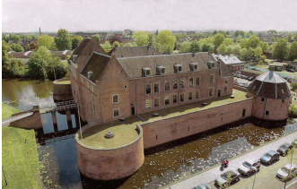
Kasteel Woerden

28 mei: Dag van het Kasteel: Van Kasteel tot Buitenplaats, het monument in ontwikkeling.