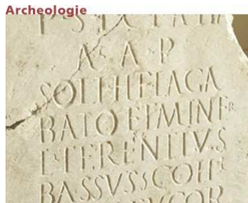
De altaarsteen in het Stadsmuseum Woerden

op: woensdag 23 mei 2012 van 20.00-22.00 uur In: Regiobibliotheek Woerden, Meulmansweg 27, 3441 AT Woerden Door ziekte van de spreker kon deze lezing eerder op 22 maart niet doorgaan,