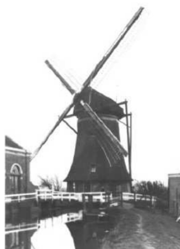
De verdwenen Broekmolen

Er zijn consumpties verkrijgbaar voor € 1,- per stuk en het boek is er voor € 10,- te koop. Het boek kan tegen een meerprijs van € 2,50 ook worden toegezonden na betaling op bankrekeningnummer 5231877 t.n.v. H. van Vuuren sponsorrekening boekje. Bestellen kan via e-mail vuad@kpnplanet.nl of telefonisch 0348-433 892. 'Verhalen rond de Broekmolen' is uitgegeven door Stichting Stichtings-Hollandse Bijdragen, reeks nummer 38, ISBN: 978-90-814805-3-6. Het boekje is ook via de Boekentafel van de SHHV verkrijgbaar.