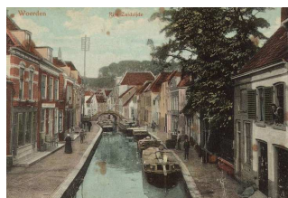
De Rijnstraat in 1915

op: zaterdag 9 juni 2012 van 11.00-16.30 uur