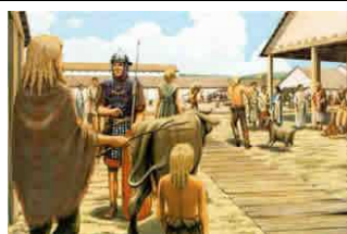
Romeinen en Germanen onderhandelen over voedsel