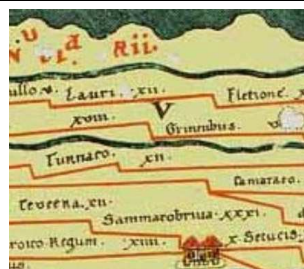
Laurium op de Peutingerkaart