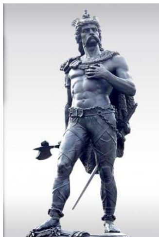
Ambiorix, van de Eburonen