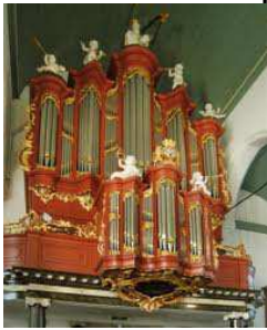
Bätzorgel in de Petruskerk

De Petruskerk in Woerden is in juli en augustus, net als in voorgaande jaren, op woensdagmorgen open voor bezoekers. Vorig jaar waren er in die periode meer dan 700 bezoekers, onder wie veel buitenlanders. De openstelling is van 9.30 tot 12.00 uur en er zijn vrijwilligers die iets kunnen vertellen over de kerk.