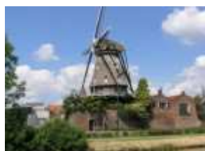
De Valk Montfoort