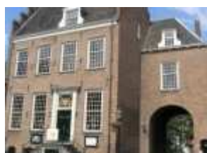
Oude stadhuis, Montfoort

12. Linschoten. Bij de Tol Nieuwe Zandweg 14, Bij Mette Dorpstraat 41, Gemaal Weidepad 1, Huis te Linschoten Noord Linschoterdijk 21, Koffiehuis Het Wapen van Linschoten Dorpstraat 34, NH Kerk Kerkplein 7, Schans/Linie van Linschoten M A Reinaldaweg 44.