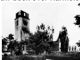
Hervormde kerk van Harmelen na de brand van 23 juni 1900