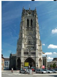
Belforte bij de Basiliek in Tongeren

We kunnen terugkijken op een geslaagde zomere excursie naar Tongeren (België). Goed weer, een gezellige groep, een uitstekende gids, lekker gegeten en een voorspoedige busreis, zowel heen als terug. Tongeren is een compact stadje uit de Romeinse tijd. Grote delen van de stadsmuur uit die tijd zijn nog zichtbaar. Het was leuk om daar bij de terugreis nog even langs te kunnen rijden. De lezing op 21 augustus, ter voorbereiding op de excursie, was ook verhelderend. De combinatie van expertise in de Keltische talen en archeologisch onderzoek, bracht onvermoede inzichten aan het licht. Waren de Friezen misschien Kelten in de Romeinse tijd? Lag Atuatuca , de hoofdstad van de Eburonen wel waar nu Tongeren ligt of hoort het beeld van Ambiorix, hun koning misschien 80 km meer naar het westen te staan. Kortom, geschiedenis beleven in optima forma.