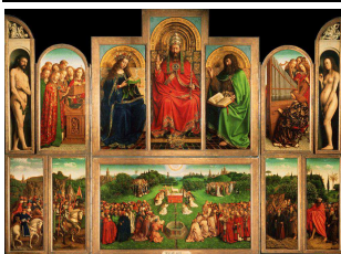
Drieluik Lam Gods Jan en Hubert van Eyck (Gent, 1432)