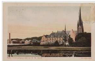
Kasteel (ca 1920).

Als u nu langs de singel loopt, ziet u het kasteel er net zo bijliggen.