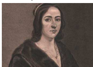
Anna Maria von Schurman (1607-1678)

Onlangs is er weer een canon gepresenteerd ©, de onderwijsanon .