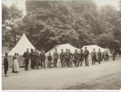
Gemobiliseerde soldaten in Woerden (1914)

Volgend jaar is het honderd jaar geleden dat de Eerste Wereldoorlog uitbrak. Hoewel Nederland neutraal bleef, had de oorlog toch grote impact op ons land. Ook in onze regio was er veel te merken van de gevolgen van deze grote oorlog. Over deze tijd in onze streek is echter nog niet veel gepubliceerd. De SHHV start in januari een projectgroep , die, in overleg met het Regionaal Historisch Archief Rijnstreek en Lopikerwaard, archiefonderzoek doet naar de gebeurtenissen in onze streek (Woerden, Oudewater, Montfoort, Bodegraven). Dat onderzoek zou kunnen leiden tot een of enkele publicaties in ons blad Heemtijdinghen en wellicht ook in andere tijdschriften in de provincie Utrecht. Indien u nog belangstelling en tijd heeft, kunt u zich aanmelden bij ons secretariaat. Wij nemen dan contact met u op.