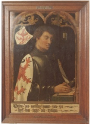
Willem II van Naaldwijk

ze als leenmannen aan de Hollandse graven vele en belangrijke diensten hebben bewezen. Dit blijkt uit het voeren van de erfelijke titel van Maarschalk van Holland. Dat ze meermalen zij aan zij met de graaf ten strijde trokken, daarvan getuigt de geschiedenis. Met name zal ook de band van Willem II van Naaldwijk (ca. 1340-1393) met Woerden nader worden toegelicht.