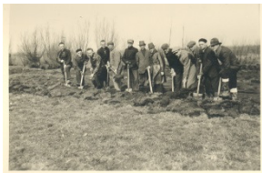
'Ook inwoners van Woerden moesten in het voorjaar van 1944 'spitten voor de moffen'.

Een lezing door Teun de Kruijf, generaal-majoor b.d.