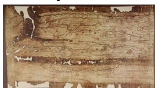
Fragment van de Peutingerkartaar

Literatuur en websites over de Peutingerkartaar