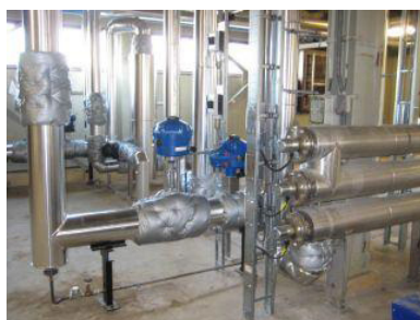
Royal Leerdam Crystal, Lingedijk 8 4142 LD Leerdam