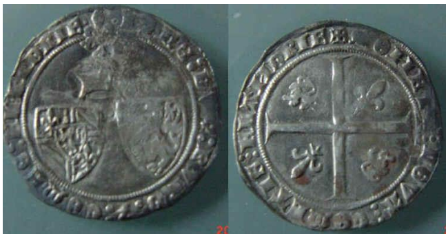
Tot de NMB-schat behoorden ook twee exemplaren van de Zilveren braspensing van Hertog Jan zonder Vrees.

Op 8 juni 1972 werd bij graafwerkzaamheden voor de bouw van de toenmalige Nederlandse Middenstandsbank op de hoek van de Jan de Bakkerstraat en de Voorstraat een kannetje met munten gevonden. Het ging om 367 zilveren munten en enkele gouden exemplaren die rond het jaar 1424 werden begraven. Bekend is dat zo'n 200 munten verhuisden naar het hoofdkantoor van de NMB, die later is opgegaan in de ING Bank. De laatste beschouwde na enige tijd het bewaren van muntschatten niet meer als een van haar kerntaken en droeg de verzameling over naar de Nederlandsche Bank.