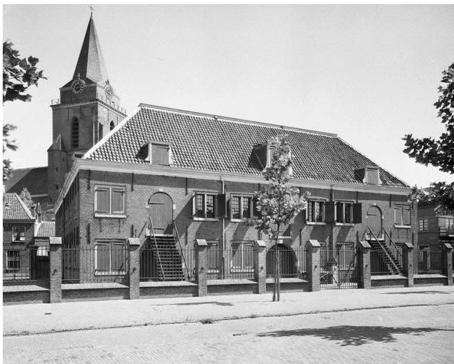
Het Arsenal te Woerden, situatie omstreeks 1959.

Locatie: De Dam, Wilhelminaweg 79 te Woerden