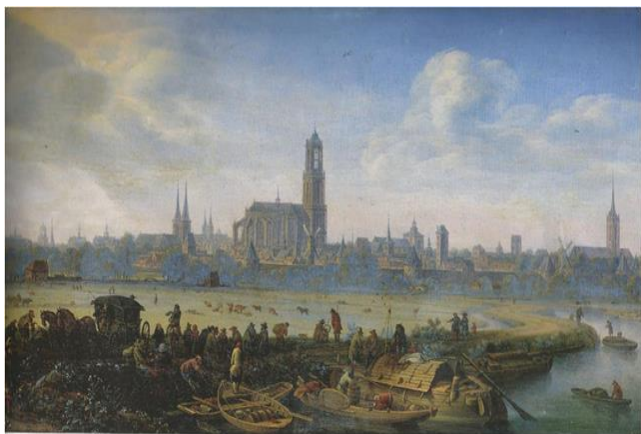
Herman Saftleven – Gezicht op Utrecht (ca 1664).

Zaterdag 28 oktober, 13.00 uur - Kosten € 3,00 per persoon, ter plaatse te voldoen Middagexcursie Utrecht – langs de plekken van de Utrechtse Meesters