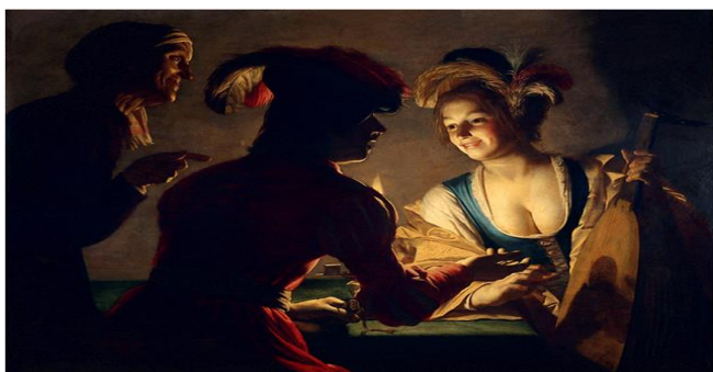
Gerard van Honthorst – De Koppelaarster.

Het caravaggisme is een stroming in de 17de-eeuwse schilderkunst die zich liet inspireren door de revolutionaire stijl van de Italiaanse meester Caravaggio. Die zet zich af tegen de classicistische retoriek van de academies en omarmt de illusionistische geestdrift van de barok. Een aparte groep in Utrecht zijn de Utrechtse caravaggisten. De voornaamste onder hen zijn Hendrick ter Brugghen, Dirck van Baburen en Gerard van Honthorst.