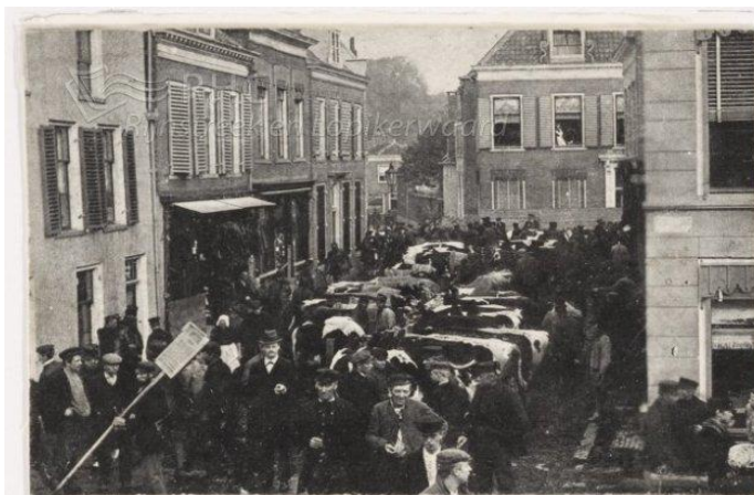
In de jaren twintig van de vorige eeuw staan de koeien in de Kruisstraat, gezien vanaf de Rijn.

De Koeiemart maakt sinds dit jaar deel uit van de Nationale Inventaris Immaterieel Cultureel Erfgoed in Nederland, onderdeel van de UNESCO-lijst. Oorspronkelijk is het een feest om stil te staan bij de opbrengst van de koeien in het afgelopen seizoen en markeert het ook het moment waarop de koeien traditiegetrouw weer op stal gaan. De traditie gaat terug tot het jaar 1410. Op 5 juli van dat jaar verleent Hertog Jan van Beieren aan Woerden een belangrijk privilege voor het houden van een "vrije jaarmarkt" voor paarden en voor runderen. Het gaat dan zelfs om twee markten, gehouden op verschillende dagen. De paardenmarkt is er drie dagen voor Sint Petrus' Banden en de runderen worden verhandeld met Sint Victor. Later wordt bepaald dat de paardenmarkt valt op de maandag na 18 oktober en de Koeiemart op de woensdag na 20 oktober. Vanaf 1935 vervalt de paardenmarkt.