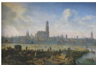
Herman Saftleven – Gezicht op Utrecht (ca 1664).

Zaterdag 28 oktober, 13.00 uur - Kosten € 3,00 per persoon, ter plaatse te voldoen Middagexcursie Utrecht – langs de plekken van de Utrechtse Meesters