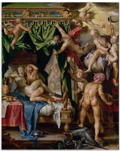
Joachim Wtewael - Venus en Mars verrast door de goden

Het caravaggisme is een stroming in de 17de-eeuwse schilderkunst die zich liet inspireren door de revolutionaire stijl van de Italiaanse meester Caravaggio. Die zet zich af tegen de classicistische retoriek van de academies en omarmt de illusionistische geestdrift van de barok. Een aparte groep in Utrecht zijn de Utrechtse caravaggisten. De voornaamste onder hen zijn Hendrick ter Brugghen, Dirck van Baburen en Gerard van Honthorst.