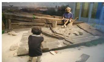
Achterschip van Woerden-7, bron: Wikimedia, Ellywa.

Aanbevolen: Geactualiseerde herdruk Limes en Linie