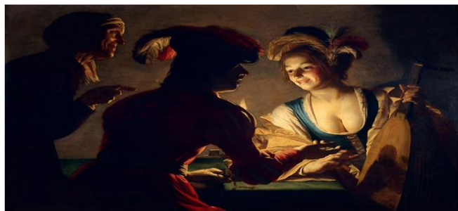
Gerard van Honthorst – De Koppelaarster (foto: collectie Ina Bertsch).

georganiseerd? Wat was hun positie in de stad? Hoe werden ze opgeleid en had de woelige historische periode invloed op hun werk? Waar woonden ze en waarom juist daar?