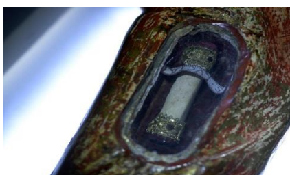
Armreliquarium met relik van de Heilige Lucia.

Wat is de kracht van relieken? Waarom worden ze gekoesterd en reizen mensen er duizenden kilometers voor? U staat oog in oog met de meest bijzondere relieken uit verschillende tijden, culturen en religies. Het woord relik komt van relinquere, wat 'overblijven' betekent. Een relik is een tastbaar overblijfsel dat herinnert aan en verbindt met een persoon, plek of gebeurtenis. Binnen het christendom, het boeddhisme en de islam kunnen relieken restanten zijn van een persoon die een voorbeeldstellend leven leidde. Maar ook voorwerpen die de mensen dichterbij hun voorouders, belangrijke