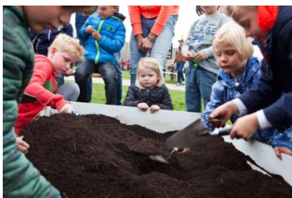
Graaf zelf naar scherven! (Bron: Museum Hoge Woerd, De Meern).

Op deze dagen kan iedereen kennis maken met alle facetten van archeologie in Nederland. De dagen brengen het verleden tot leven, vertellen het verhaal van vroeger en zijn een unieke gelegenheid om eens mee te kijken wat er allemaal in de Nederlandse bodem verborgen zit en zat. De Archeologiedagen sluiten aan bij het Europees Jaar van het Cultureel Erfgoed. Het Museum Hoge Woerd in De Meern organiseert tal van activiteiten voor jong en oud. Maar ook op andere plekken binnen en buiten de provincie Utrecht kun je terecht. Kijk op: https://www.archeologiedagen.nl/programma-2018/ .