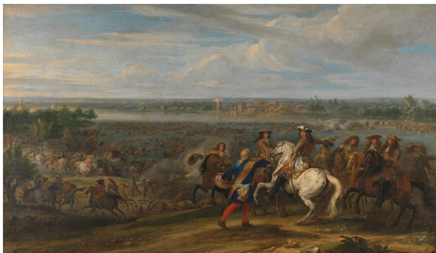
Lodewijk XIV trekt bij Lobith de Rijn over, 12 juni 1672. Adam Frans van der Meulen, ca. 1672-1690.

Locatie: Kapel Weddesteyn, Utrechtsestraatweg 50, 3445 AS Woerden.