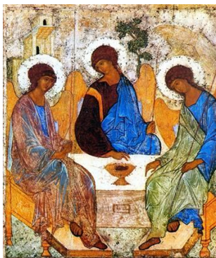
(Collectie Paul Bröker).

Dinsdag 27 november, 20.00 uur – toegang gratis Ds. Haitsma lezing – Iconen – verzorgd door Paul Bröker Locatie: Lutherse Kerk, Jan de Bakkerstraat 11, 3441 ED Woerden.