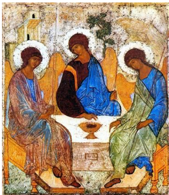
Oudtestamentische Triniteit (ca 1425) van de Russische iconenschilder Andrej Roeblov (1360-1430).