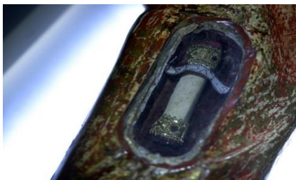
Armreliquarium met relik van de Heilige Lucia (Afbeelding: Museum Catharijne Convent).

Expositie: "Relieken", tot en met 13 februari 2019