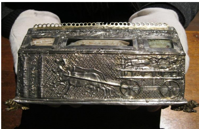
De relik van St. Fursa die zich nu in de schatkamer van de kathedraal van Amiens bevindt. Hij is afkomstig uit het kerkje van Gueschart, dat aan Fursa is gewijd, en dateert uit ongeveer 1460.

Waarom worden relikven gekoesterd en reizen mensen er duizenden kilometers voor? U staat oog in oog met de meest bijzondere relikven uit verschillende tijden, culturen en religies. Binnen het christendom, het boeddhisme en de islam kunnen relikven restanten zijn van een persoon die een voorbeeldstellend leven leidde. Maar ook voorwerpen die de mensen dichterbij hun voorouders, belangrijke staatshoofden, historische helden, idolen en andere rolmodellen brengen, zijn al eeuwenlang populair. Het Museum Catharijne Convent te Utrecht brengt al deze aspecten samen in deze unieke tentoonstelling. Meer informatie: www.catharijneconvent.nl