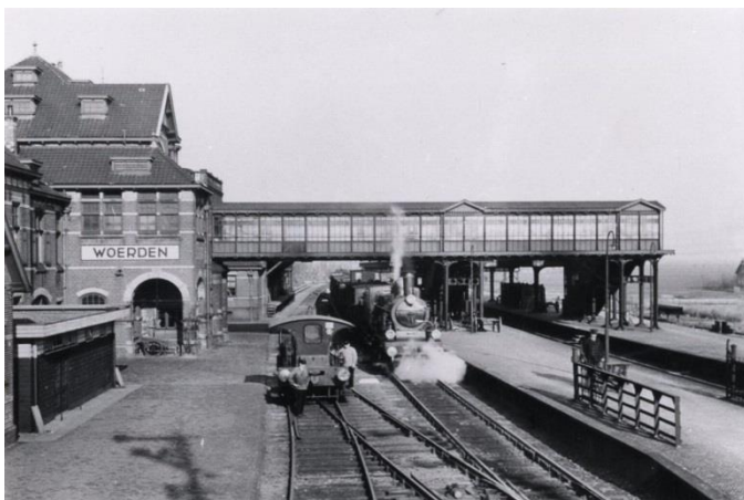
Station Woerden in de jaren dertig van de vorige eeuw. (Foto: Nederlandse Spoorwegen / collectie Het Utrechts Archief / 164830).

Bij een wandeling langs het Jaagpad langs de Oude Rijn bij Harmelen, mijmerde ik over de ontwikkeling in het openbaar vervoer. Met het gereedkomen van de dubbele spoorbrug over het Amsterdam-Rijnkanaal bij Utrecht bestaat het spoortraject tussen Woerden en Utrecht uit vier sporen. Met deze grotere railcapaciteit kan NS een betere service bieden. Viermaal per uur een Sprinter en tweemaal per uur een Intercity. Misschien kan station Woerden in de toekomst weer worden aangesloten op het landelijk Intercitynet of op het opnieuw in te voeren Sneltrainnet? Hoe anders was dat bij de opening van het station Woerden, in 1855. De eerste dienstregeling vermeldt vijf treinen per dag in beide richtingen. In de jaren daarna worden ook de lijnen Woerden-Leiden en Woerden-Breukelen geopend en stijgt het aantal passagiers, overstappers en ... treinen steeds verder.