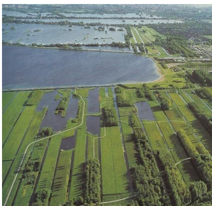
(Bron: Sophie Visser)

Locatie: De Dam, Wilhelminaweg 79, 3441XB, Woerden.