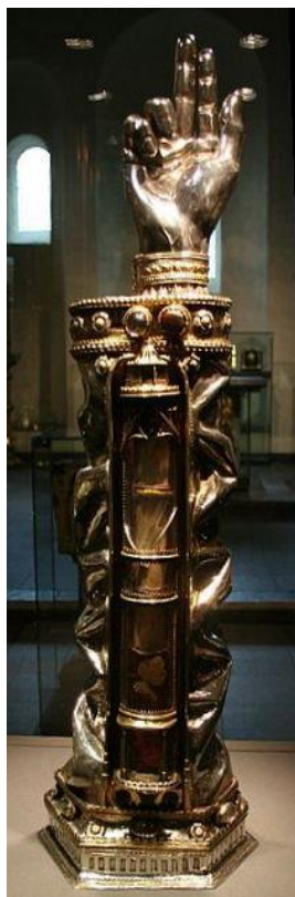
Armreliëkhouders van Sint Thomas in de Sint Servaasbasiliek Maastricht.

Locatie: De Dam, Wilhelminaweg 79, 3441XB, Woerden.