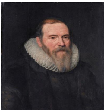
Johan van Oldenbarnevelt (1547-1619), atelier Michiel Jansz van Mierevelt.

Is 2019 een bijzonder jaar? In veel opzichten wel en dat zult u ook nog merken aan de selectie van onderwerpen voor de lezingen. Eén gebeurtenis springt er misschien toch wel uit. Op 13 mei 1619, vierhonderd jaar geleden dus, vond een politieke moord plaats in Den Haag toen Johan van Oldenbarnevelt werd onthoofd op het schavot. Zijn veroordeling was het resultaat van een politiek en religieus verschil van inzicht met prins Maurits van Oranje, de tweede zoon van de Vader des Vaderlands. Na de moord op Willem in Delft (1584) ontstond een machtsvacuüm waarin Johan snel furore maakte in het landsbestuur. Korte tijd later werd hij landsadvocaat en raadspensionaris en hij zorgde ervoor dat Maurits in het zadel werd geholpen als stadhouder en politiek leider van de Republiek.